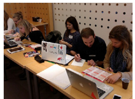
Les étudiants du MASDI produisent du contenu à l'occasion de la Nantes Digital Week.

"Mes missions chez Mellow Yellow en tant qu'assistante marketing digital : community management, rédaction de contenu éditorial pour le site, mise en place de partenariats avec la blogosphère lifestyle... La spécialisation en apprentissage manager en stratégie digitale me permet de suivre l'évolution des projets sur le long terme et m'apporte les clés nécessaires pour être performante."